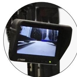
Kamera med HD display